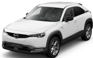
A4D Arctic White