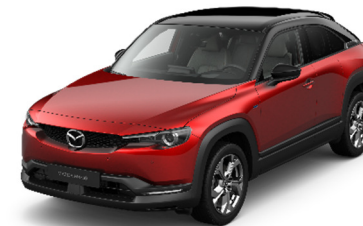
49V Soul Red Crystal