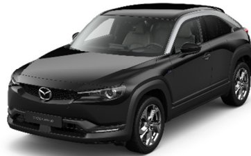
49P Jet Black - Silver