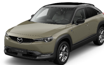
49T Zircon Sand