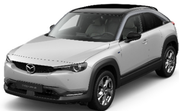
48A Ceramic White