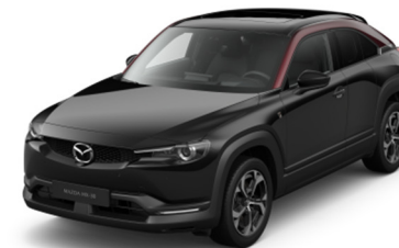
49F Jet Black – Maroon Rouge (nemokamai)