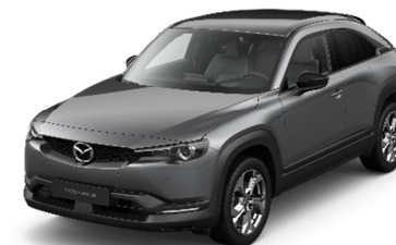
46G Machine Gray

Kelių tonų dažų spalvų parinktys (tik Makoto modelių versijoms)