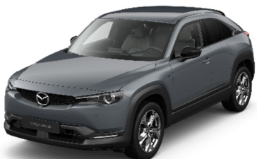
47C Polymetal Gray