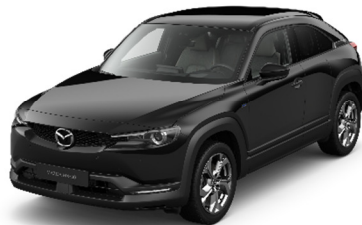
41W Jet Black